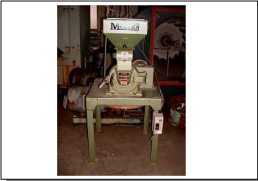
高速度粉碎機(ピンミル) 2機